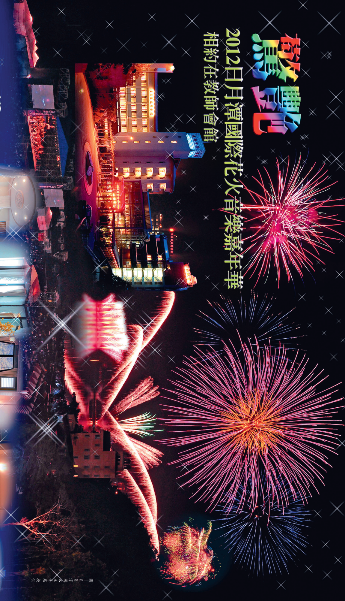
圖 日月潭國際火花音樂嘉年華