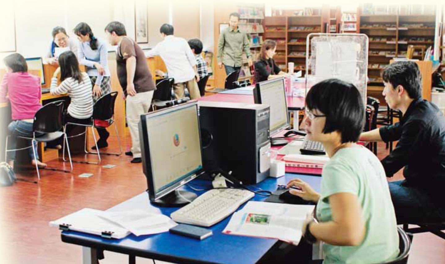
推動「教師專業學習社群」，可讓教師先建立共同願景，培養出信任與合作的夥伴關係，即能改善夥伴難尋的困境。

再者，推動「教師專業學習社群」應比直接推動「教師專業發展評鑑」來得容易被認同及獲得實質成效，以社群的基礎來推動評鑑應當有事半功倍之效，而最終達成教師專業發展的目標。師