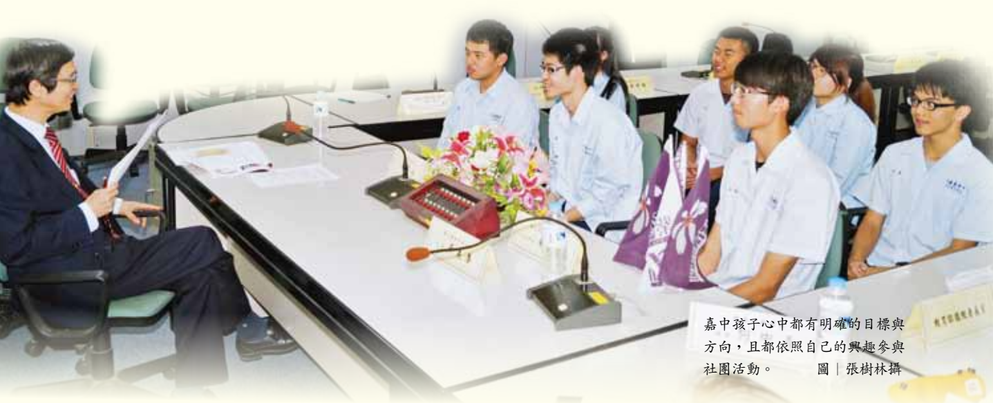
嘉中孩子心中都有明確的目標與方向，且都依照自己的興趣參與社團活動。

(健康)四大方向，希望嘉中人能心存關懷、活力十足、真誠感人及身心健康。故除了鼓勵學生用功讀書以外，也重視適當的休閒娛樂，希冀透過活潑多樣的社團活動培養興趣、增進人際關係與處事能力。就我的經驗，找一樣適合自己興趣的活動，如球類運動、音樂或畫畫，在累時有調劑身心的作用，可以沉澱心情、紓解壓力，為自己充電或加油，心情修復後往往又可以重新整裝再出發。