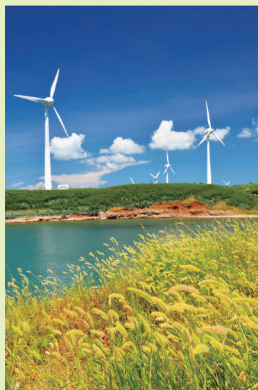
澎湖的中屯風車