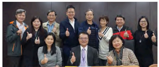
師友雙月刊編輯委員會