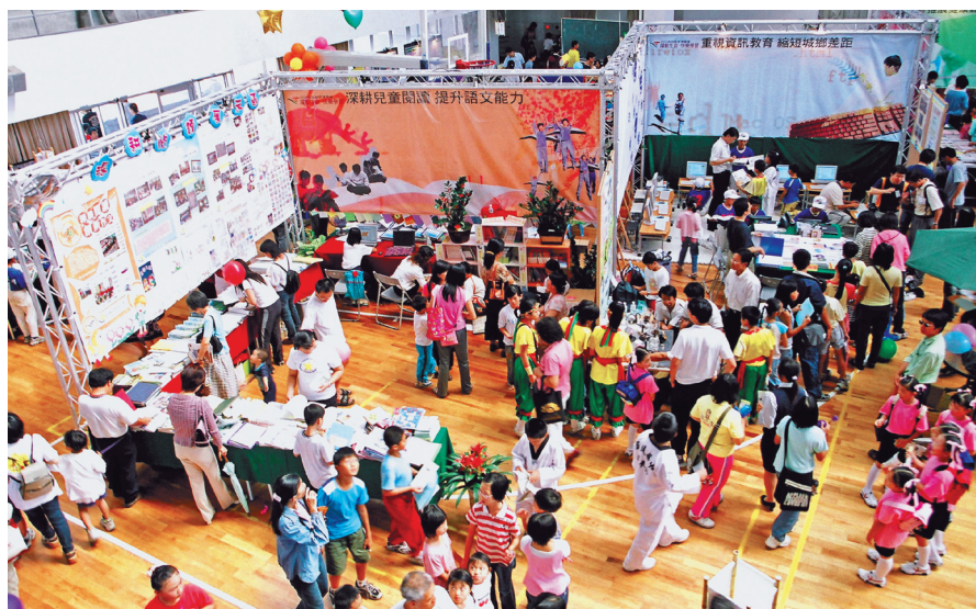
弱勢孩子不是沒有發展潛力，只要給他適度協助、機會和時間，一樣可以有好表現，甚至超越高社經地位的孩子。

過去在師資培育公費的時代，國家培養出不少優秀人才，這些人才不管是服務於教育界、公職或者其它行業，都有傑出表現，對國家具有相當大的貢獻，深獲社會肯定，現任教育部吳清基部長與筆者都是公費的受益者，也深深感受到對社會和教育有一種使命感和責任感。倘若當時沒有公費制度，我們就不一定有機會接受高等教育。所以，公費制度不僅造就人才，也造福社會。