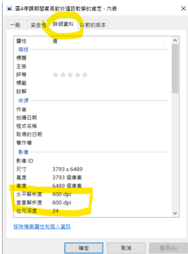
圖 2 高畫素圖片 300DPI 以上