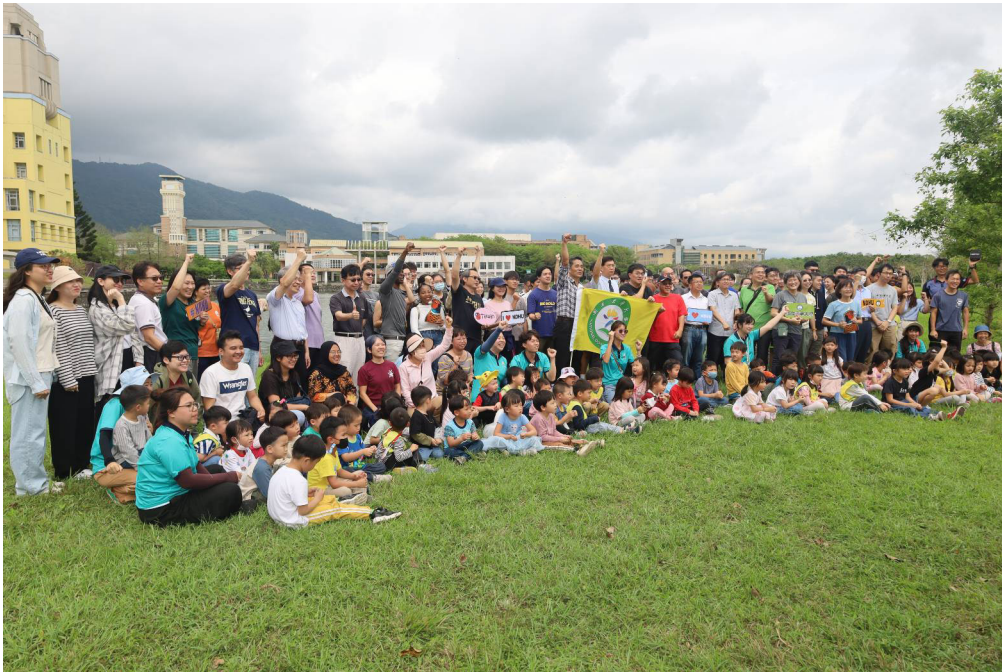
圖 2 邀請教職員生共同拍攝校園韌性短片

將既有結構與文化激發為自我修復的動能。東部強震雖在校舍留下裂痕，卻也在無形中淬鍊出前所未有的韌性素養。所謂「組織韌性」(Organizational Resilience)，即指組織面對突發衝擊時，能迅速調適、持續運作並從經驗中學習的能力。然而，韌性不僅是意志凝聚，更須仰賴資源整合 (Vogus & Sutcliffe, 2007)。徐輝明校長指出：「這個危機你要怎麼處理，就要很快速的決斷能力……地震中突生化學火災，屬複合型，但差別性太大……在不同災害裡，你需